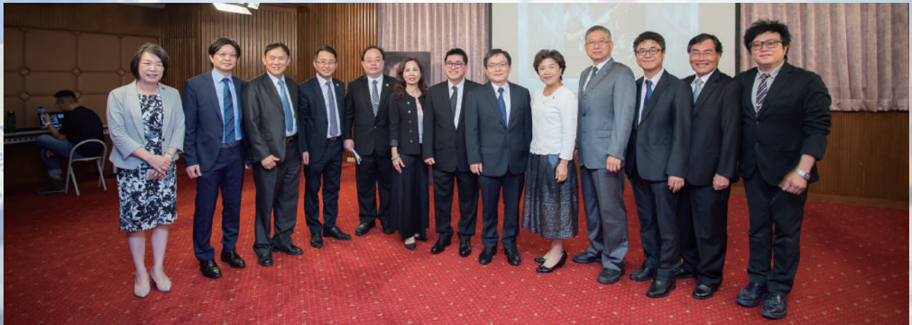
▲ 108.8.16 本會、高雄市政府法制局、高雄市社會企業發展協會共同舉辦公益法治微電影沒想這麼多首映會。