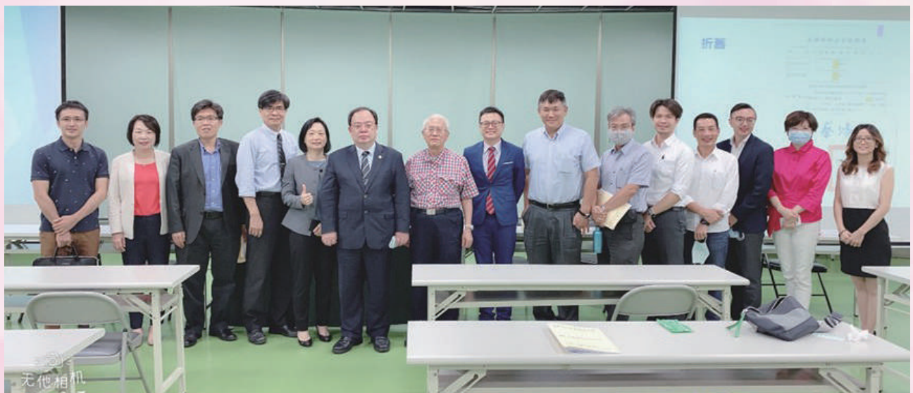
▲ 109.6.13 新進會員聯誼研討會「新律師稅務申報完全攻略」（資深律師經驗分享）。