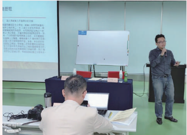
▲ 109.6.21 全聯會律師學院與本會共同規劃合辦南區場在職進修課程「被害人律師研習課程」主講人：王子榮 法官。